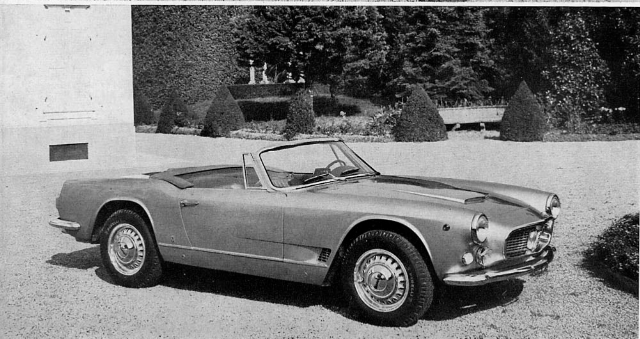
convertibile carburatori convertibile iniezione